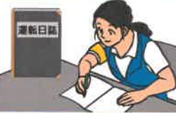
運転日誌の備付け