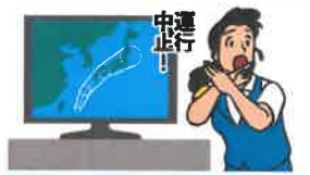
異常気象時等の措置