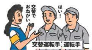
交替運転者の配置